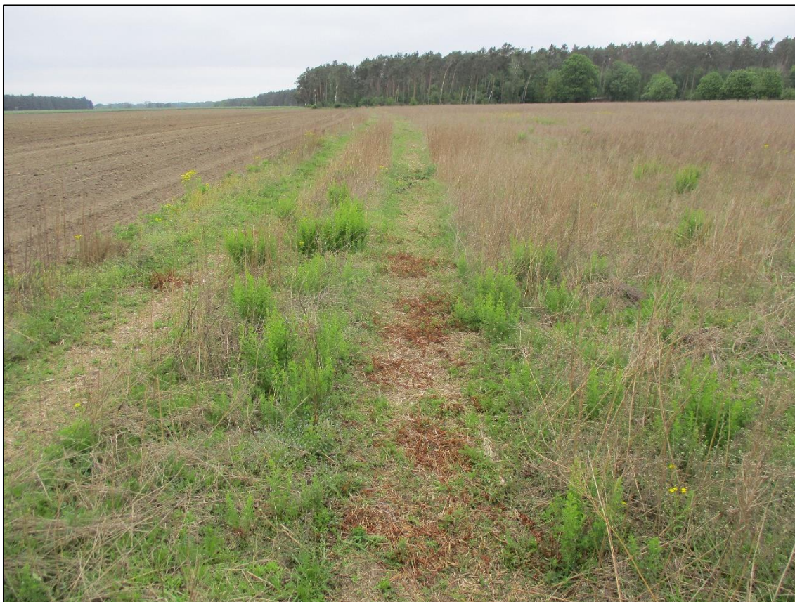
Abb. 4: Südwestlicher Rand des Plangebiets, Blick Richtung Nordwesten (05.07.2024)