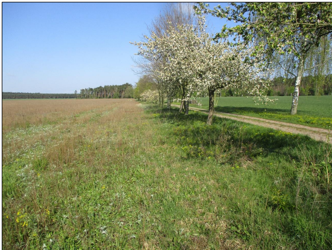
Abb. 2: Nordöstlicher Rand des Plangebiets, Blick Richtung Nordwesten (23.04.2024)