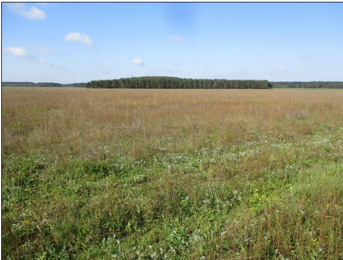
Abb. 3: Blick vom Plangebiet in Richtung Westen (23.04.2024)