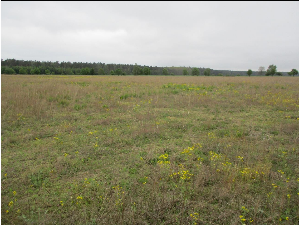
Abb. 5: Blick vom Plangebiet in Richtung Osten (05.07.2024)