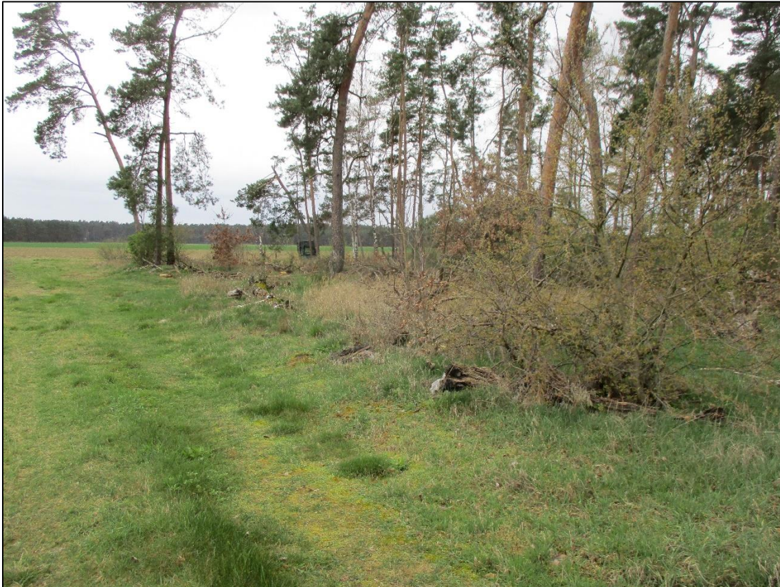
Abb. 6: Übergangszone zum Wald am nordwestlichen Rand des Plangebiets (03.04.2024)